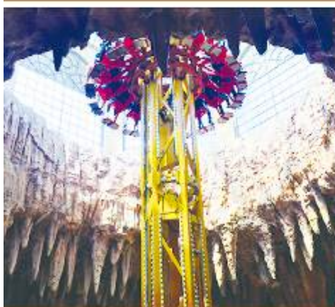
FANTASY PARK 夢想公園