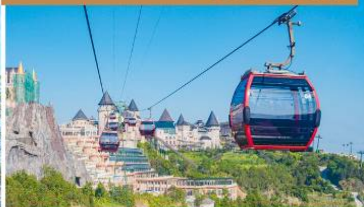
法式城堡巴拿山歡樂遊:搭乘纜車