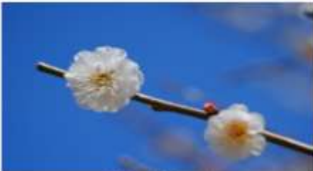
白鞠流（しろまにわ）

早咲きの時期の楽しみ方は“探梅”。まだ固い蕾が多い中、ほころんだ梅の花を一輪一輪探しながら散策してみましょう。代表的な早咲き品種は「八重赤紅」「白鞠流」「八重冬至」「烈公梅」など。