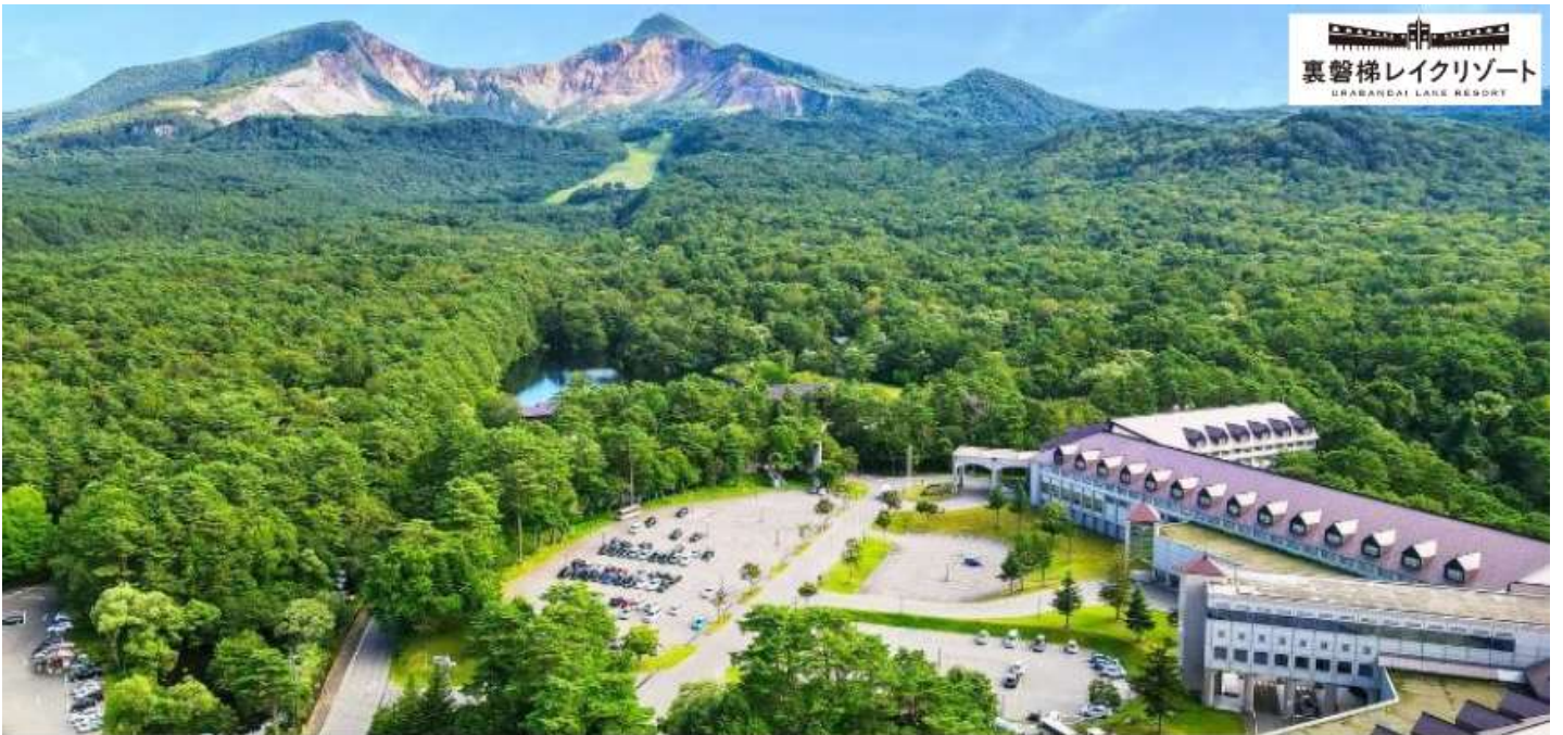
裏磐梯レイクリゾート URABANDAI LAKE RESORT