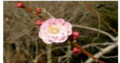
江南所無（こうなんしょむ）

遅咲きの時期の楽しみ方は“送梅”。遅く咲き始めた梅の香りを楽しみながら、去りゆく梅の季節を見送ってみましょう。代表的な遅咲き品種は「白加賀」「春日野」「江南所無」などです。