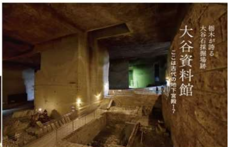
栃木が誇る 大谷石採掘場跡 大谷資料館 ここは古代の地下宮殿！？

位於宇都宮市街西北約7公里位置的大谷地區，產出的大谷石，為著名的建築物、倉庫藏、民家藏等，其活用幅度很廣。在高度成長期需要大力的延伸，在大谷地區採掘盛行。在採掘場形成巨大的地下空間。同時，於現在跡地能見到古代遺跡那樣的趣味。成為飄浮著幻想氣氛的獨特場所之地下空間。宇都宮一個魅力之物大谷石的地下世界，年均溫維持在攝氏九度。