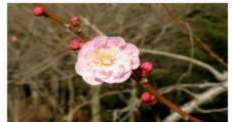
江南所無（こうなんしょむ）

遅咲きの時期の楽しみ方は“送梅”。遅く咲き始めた梅の香りを楽しみながら、去りゆく梅の季節を見送ってみましょう。 代表的な遅咲き品種は「白加賀」「春日野」「江南所無」などです。