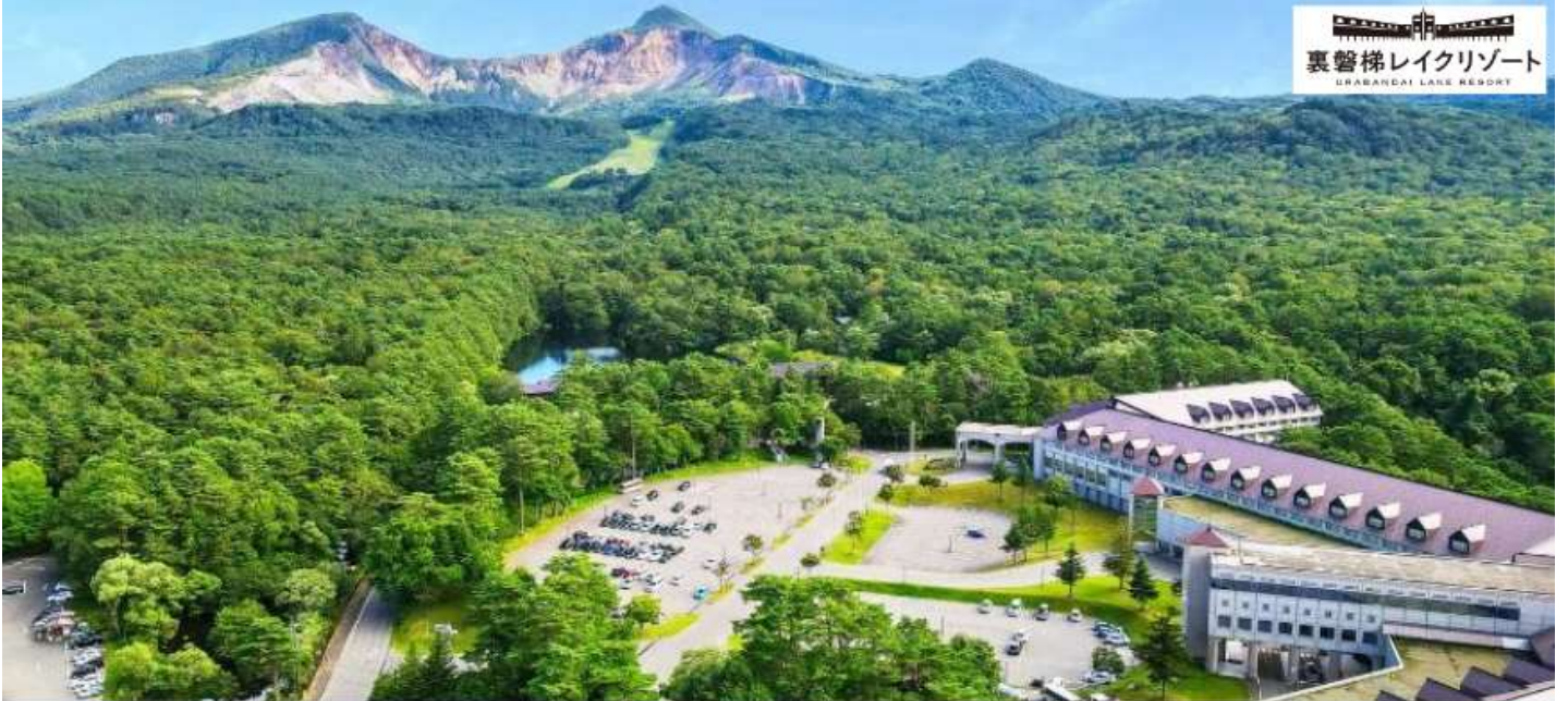
裏磐梯レイクリゾート URABANDAI LAKE RESORT