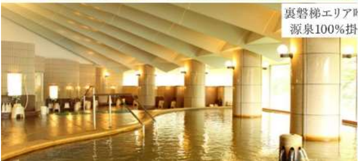
裏磐梯エリア唯一の自噴式 源泉100%掛け流し温泉