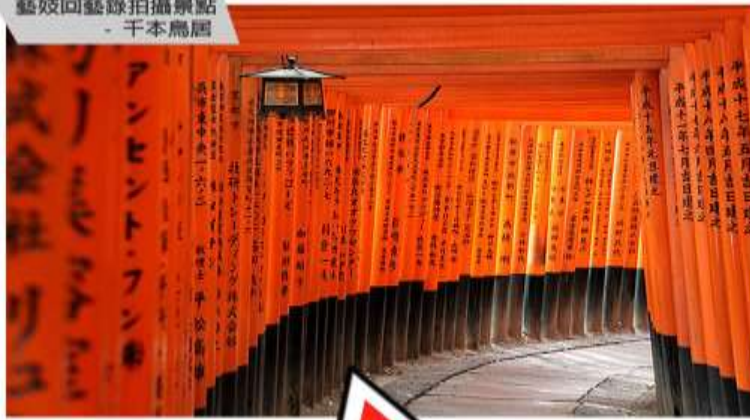
藝妓回藝錄拍攝景點 - 千本鳥居