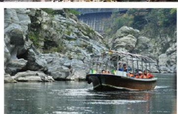
特別安排 搭乘遊船賞美景

在搭乘遊船的30分鐘航程中，可以欣賞德島大歩危峽谷的壯麗風光。上船之後可以脫掉鞋子，悠閒地坐在榻榻米上順流而下，有充分的時間可以欣賞碧綠的湖水及兩岸聳立的岩壁。由大歩危峽出發，順流而下可進一步體驗山谷之美，沿途溪谷岩壁交錯，可見識到德島縣天然紀念物～蝙蝠岩、獅子岩等特殊奇景。也被稱為《日本三大祕境》之一。