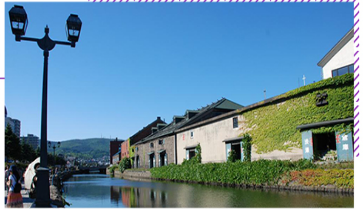
~漫步在悠揚的小樽運河，任身影在夕陽餘暉裡伸展~

北海道人氣觀光景點之一，寬20~40公尺不等，全長1300公尺。運河旁有大正、昭和時代所留下的由紅色磚瓦建造而成的大型倉庫，石造的牆垣刻劃出當時的歷史情緒，與運河組合成一幅美麗的風景畫。運河廣場附近的瓦斯燈，則要在半昏暗的夜色中方能顯出它的綺麗。