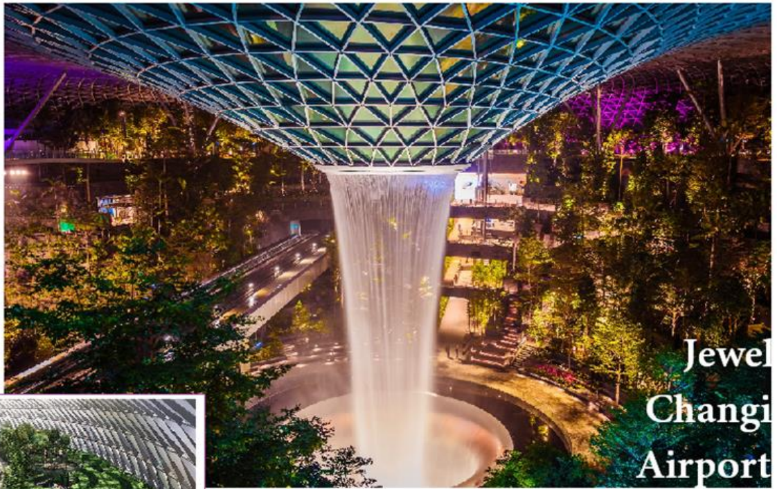
Jewel Changi Airport