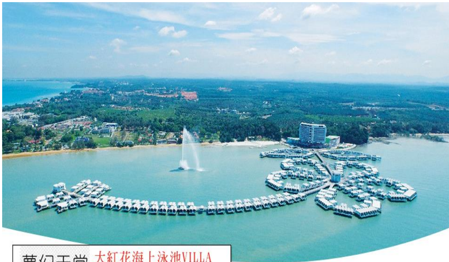
夢幻天堂 大紅花海上泳池VILLA HIBISCUS RESORT