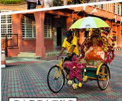
馬六甲復古三輪車