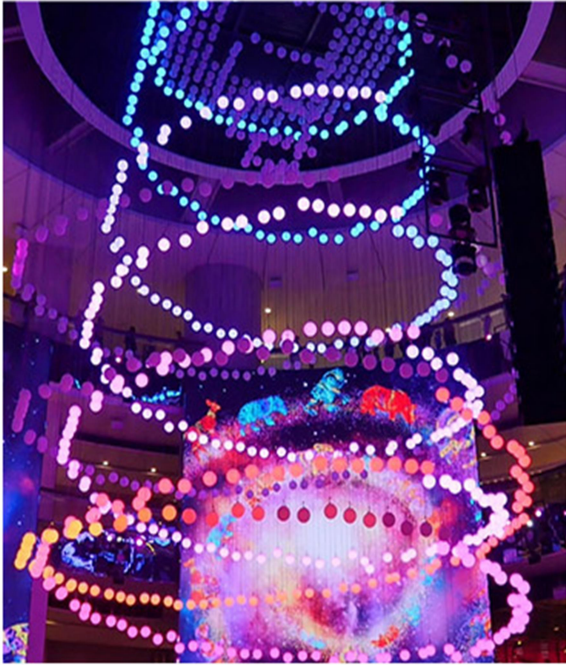
SkySymphony 光與聲的夢幻交響樂