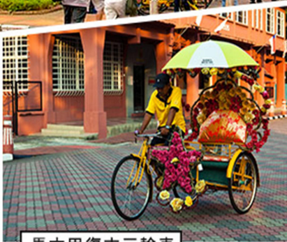
馬六甲復古三輪車