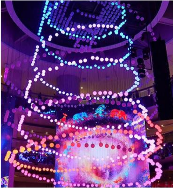
SkySymphony 光與聲的夢幻交響樂