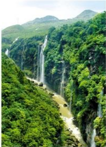
上看如地縫，下看如天溝