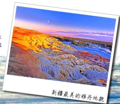
新疆最美的雅丹地貌

上帝打翻的調色盤!就像是一幅油畫巨作,令人醉心,畫中有著五彩山,如同美人般端立其間,地貌起伏下形成奇峰怪石各種姿態,呈現赭紅為主夾雜黃白黑綠等多種顏色,中國唯一一條注入北冰洋的河流--額爾齊斯河穿其而過。南岸有綠洲、沙漠,北岸則是色彩斑斕的泥岩、沙岩及砂礫組成的奇岩怪石,兩種截然不同的地貌,唇齒相依地遙相輝映。可謂"一河隔兩岸,自有兩重天"。