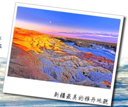
新疆最美的雅丹地貌