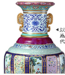
◀以明清皇室舊藏文物為基礎，堪稱中國古代藝術品的寶庫。