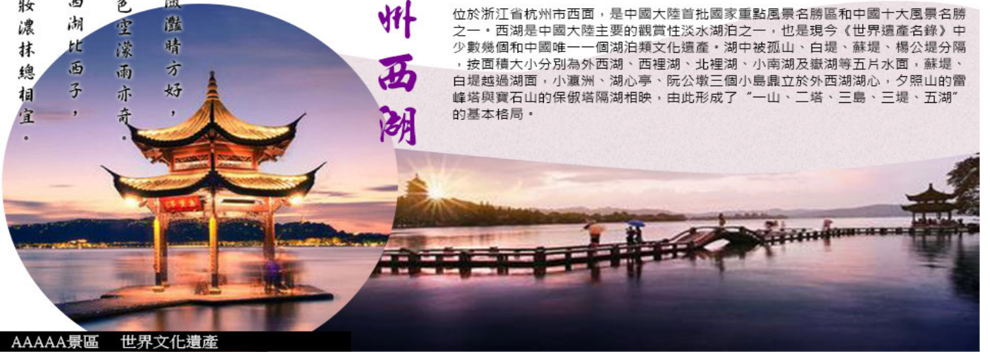
AAAAA景區 世界文化遺產