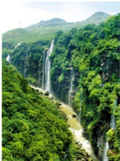
上看如地縫，下看如天溝

景區以黃果樹瀑布為中心，有地面有18個瀑布，地下有14個瀑布。黃果樹瀑布是亞洲最大的瀑布。黃果樹瀑布最奇特的地方是在瀑布背後隱藏著一條百公尺長的水簾洞、洞中除了觀賞千奇百怪的鐘乳石、更可置身洞中觀賞瀑布、令您此生難忘。