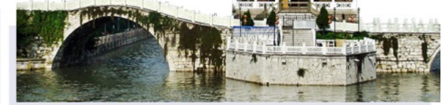
◀當夜幕降臨，華燈初上，到此一遊又是一番別有情趣的魅力。