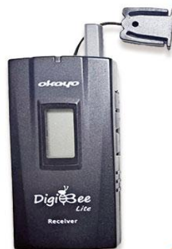
全程專業導覽耳機

本行程所附之語音導覽器為租借使用，如因旅客個人因素遺失或損壞，依廠商規定需賠供每台機器NT$2000，特此說明。