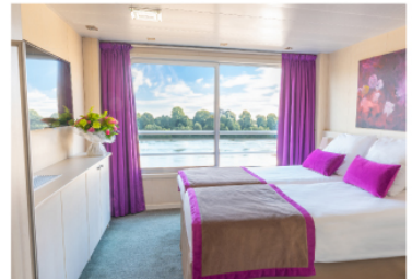
三樓上層·法式陽台房