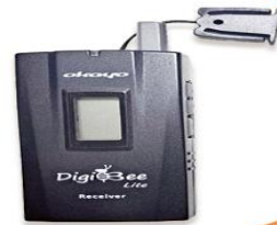
全程專業導覽耳機

本行程所附之語音導覽器為租借使用,如 因旅客個人因素遺失或損壞,依廠商規定 需賠償每台機器NT$2000,特此說明。