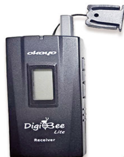
全程專業導覽耳機

本行程所附之語音導覽器為租借使用,如因旅客個人因素遺失或損壞,依廠商規定需賠償每台機器NT$2000,特此說明。