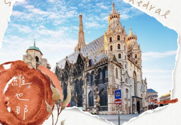
S. Stephen's Cathedral

位於奧地利維也納市中心，是天主教維也納總教區的總主教座堂，同時擁有全球第二高的哥德式尖塔。其色彩斑斕、圖案精緻的琉璃瓦拼花屋頂，更使其成為維也納最具代表性的地標之一。