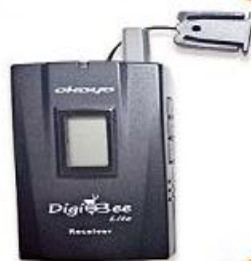
全程專業導覽耳機

本行程所附之語音導覽器為租借使用，如因旅客個人因素遺失或損壞，依廠商規定需賠償每台機器NT$2000，特此說明。