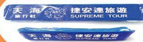
行李束帶一條 (顏色隨機)