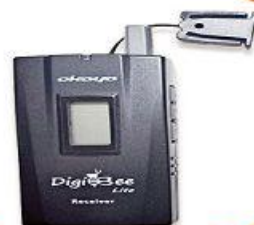
全程專業導覽耳機

本行程所附之語音導覽器為租借使用，如因旅客個人因素遺失或損壞，依廠商規定需賠供每台機器NT$2000，特此說明。