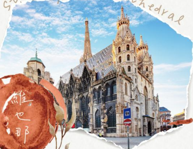
St. Stephen's Cathedral

位於奧地利維也納市中心，是天主教維也納總教區的總主教座堂，同時擁有全球第二高的哥德式尖塔。其色彩斑斕、圖案精緻的琉璃瓦拼花屋頂，更使其成為維也納最具代表性的地標之一。