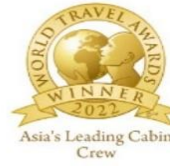
汶萊航空歷年得獎獎章