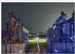
哈爾濱香格里拉酒店